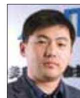
高峰 首席运营 中美奥达